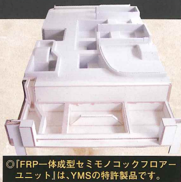
◎「FRP一体成型セミノックフロアユニット」は、YMSの特許製品です。