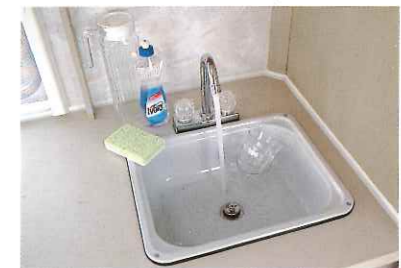
■ ホーローシンク&フォーセット