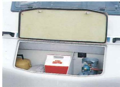
■フロントストレージBOX