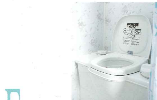
■ カセットトイレ(オプション)