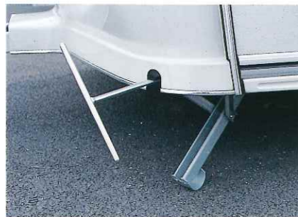
■コーナージャッキ