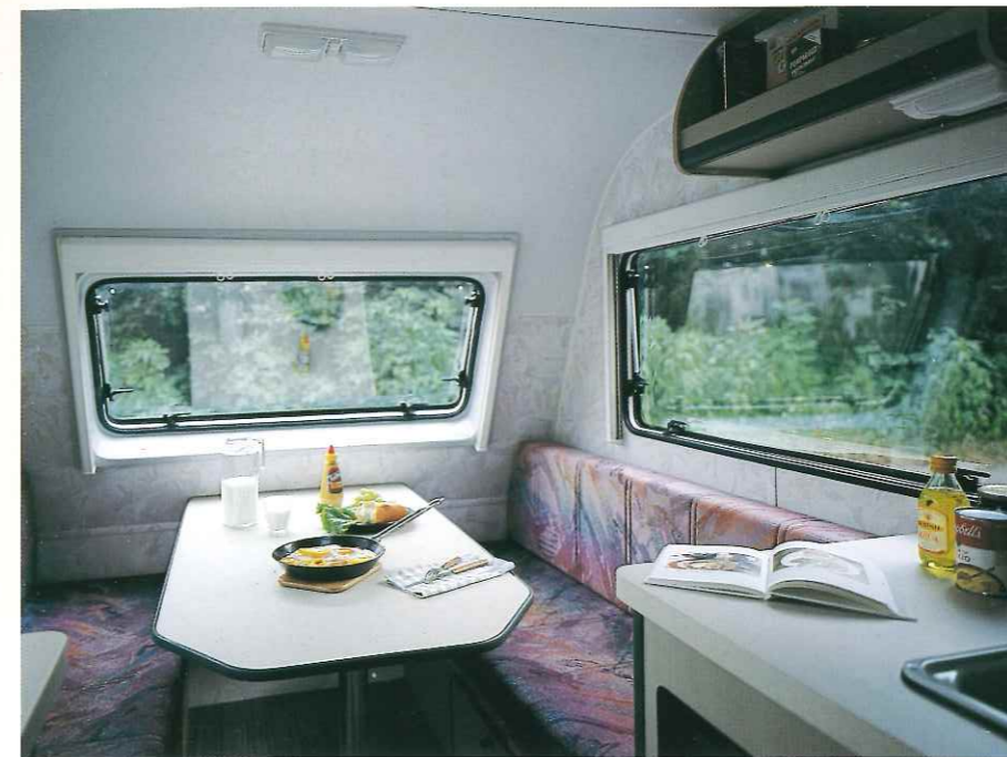
■ ゆったり食事を楽しめるダイネットシートとダイネットテーブル