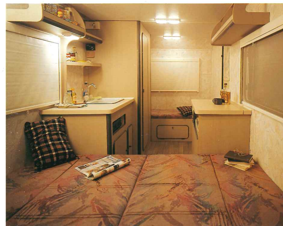
■ 自然環境のなかでわが家の寝心地を約束するベッド