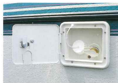
■給水口(シティウォーターホックアップ付)

ファンシーは、ヨーロッパにおいてトレーラーフレームのトップメーカーであるアロイスコーバー社(独)のシャーフフレームを使用し、日本の風土や使用環境を十二分に考慮し、設計から製造まですべてをヨコハマモーターセールスが手がけた数少ない国内の量産トレーラーです。海岸近くの塩害による腐蝕を防止するため、全面FRPボディを採用。また、床の腐蝕の原因となる駐車中の地面からの湿気や、走行中の水はねなどを防ぐため、床板下面にまでFRPスキンの被覆が施されています。それは正にヨーロッパテクノロジーの正統を高性能に磨き上げた技術の結晶といえるでしょう。その価値は価格に優るものとして、きっとご満足いただけます。