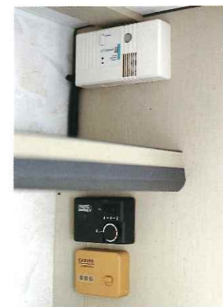
■ COアラーム(オプション) FFクリーンヒーターコントロールユニット(オプション) ウォーターヒーターコントロールユニット(オプション)