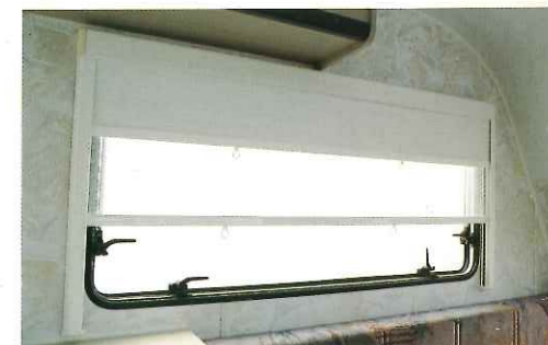
■ フライスクリーン&ローラーシェード付 二重アクリルウィンドウ