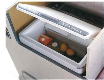
■ 着脱式2ウェイ冷蔵庫(オプション)