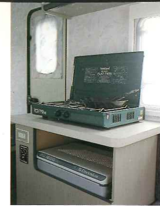
■ ツーバーナーガスレンジ(オプション)