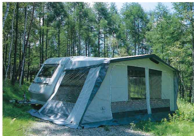
■居住空間をグーンと広げるサイドテントルーム(オプション)