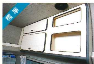
標準 オーバーヘッドキャビネット(右)