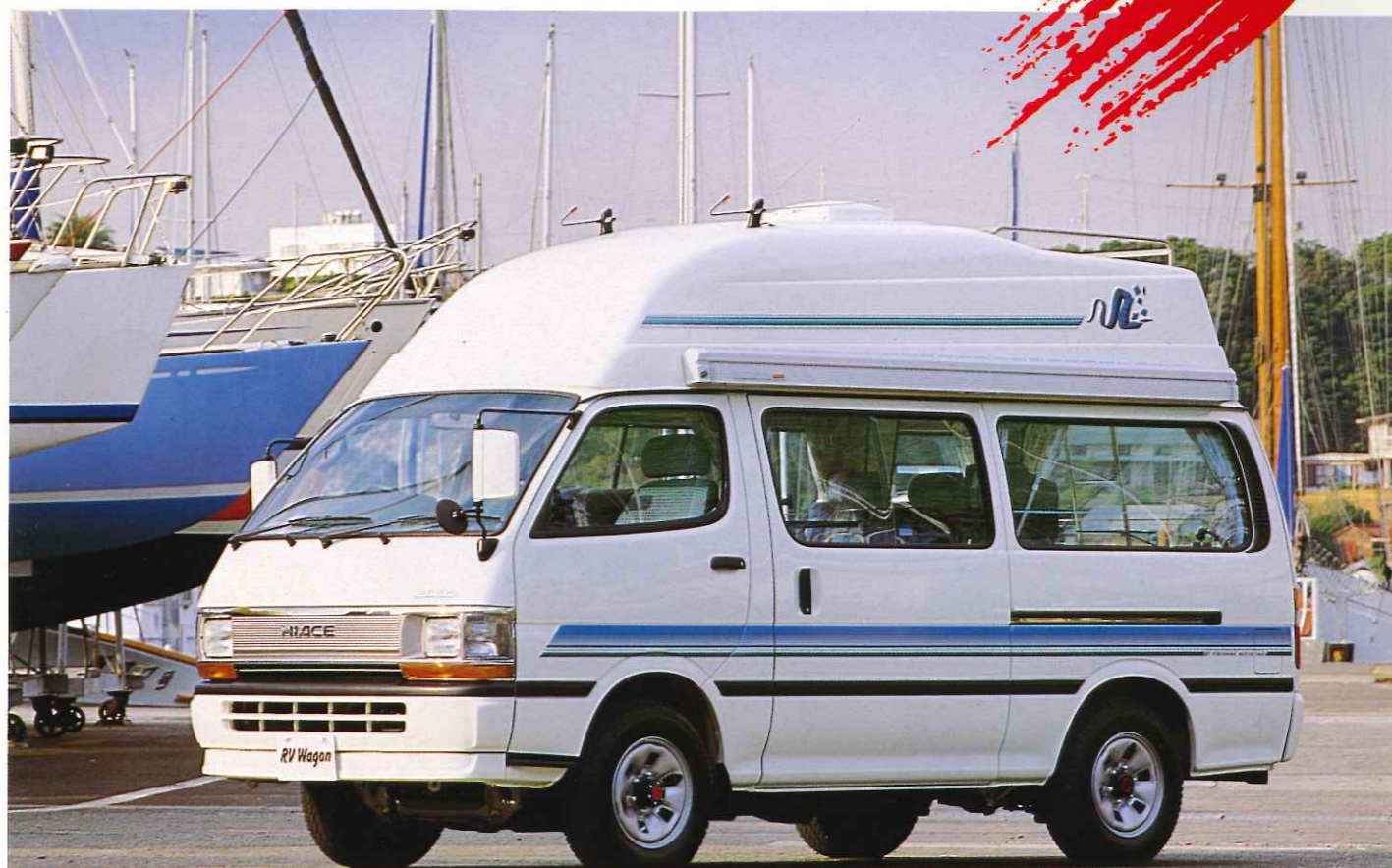
写真のストライプは標準装備