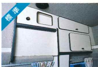
標準 オーバーヘッドキャビネット(左)