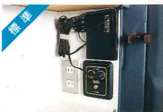
標準 アクセサリコンセント