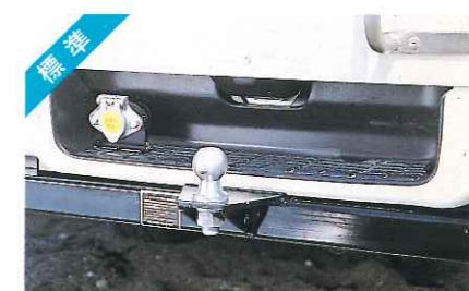
ヒッチメンバー(トレーラーけん引装置)