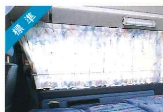
標準 カーテン&プライバシーカーテン