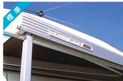
サイドオーニング