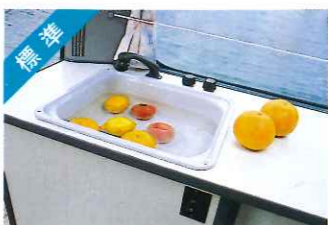
標準 ホロー製シンク