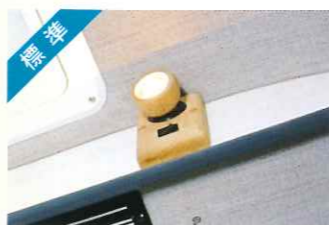
標準 スポットランプ