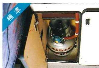
標準 2kgLPボンベ&カットOFFバルブ