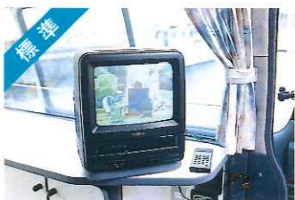
標準 ビデオ&テレビ