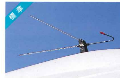
TVアンテナ(ダイバー)