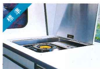
標準 カセットレンジ