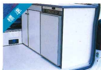
標準 3ウェイ冷蔵庫