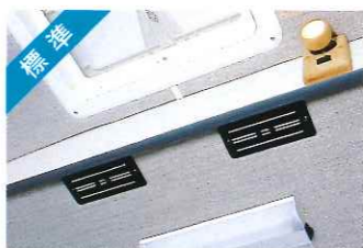
標準 オーバーヘッドリヤクーラー&ヒーター