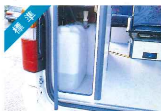
標準 給排水タンク