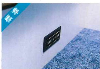
標準 クーラー&ヒーター足元吹き出し口