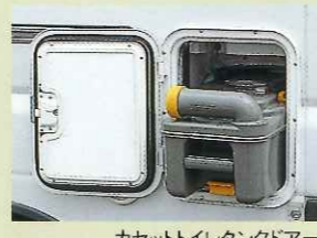
カセットイレタンクドア