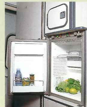
収納BOX & 40/3ウェイ冷蔵庫