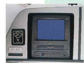
ビデオ付TV & ダイバーシティーユニット