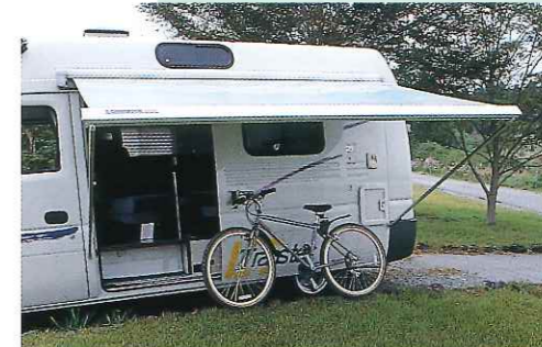
サイドオーニング