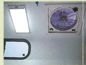
3スピード給排気ルーファンチレーター