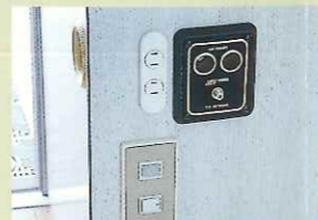
ウォーターヒータースイッチ & AC・DCコンセント