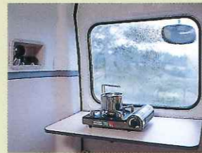
カセットコンロ & 収納式コンロテーブル