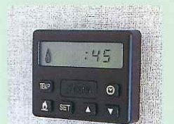
FFクリーンヒーターコントロールユニット