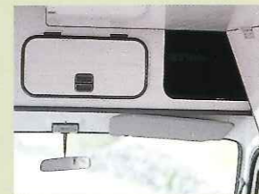
フロントオーバーヘッドコンソール